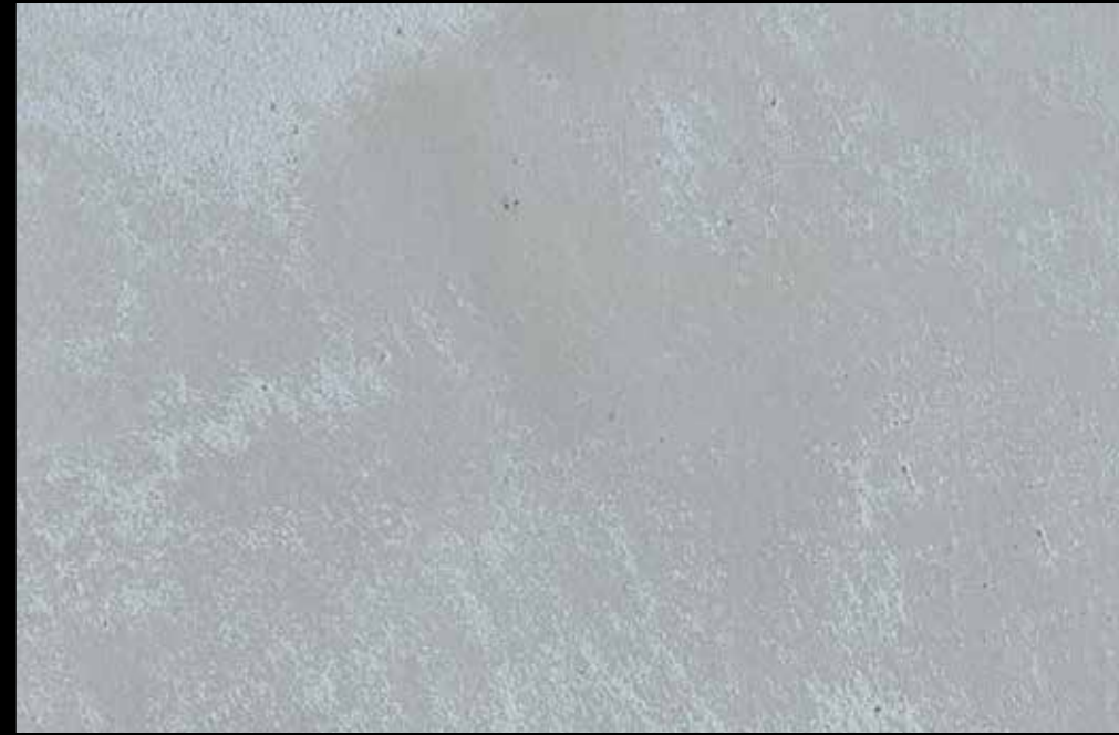
Rif. 10 NAUTILUS (LT. 1) + COLORI' Col. 448 C (2 ML.) MAVERICKS (LT. 0,500) + L50 Col. 304 (LT. 0,100) MAVERICKS (LT. 0,500) + L50 Col. 307 (LT. 0,100)