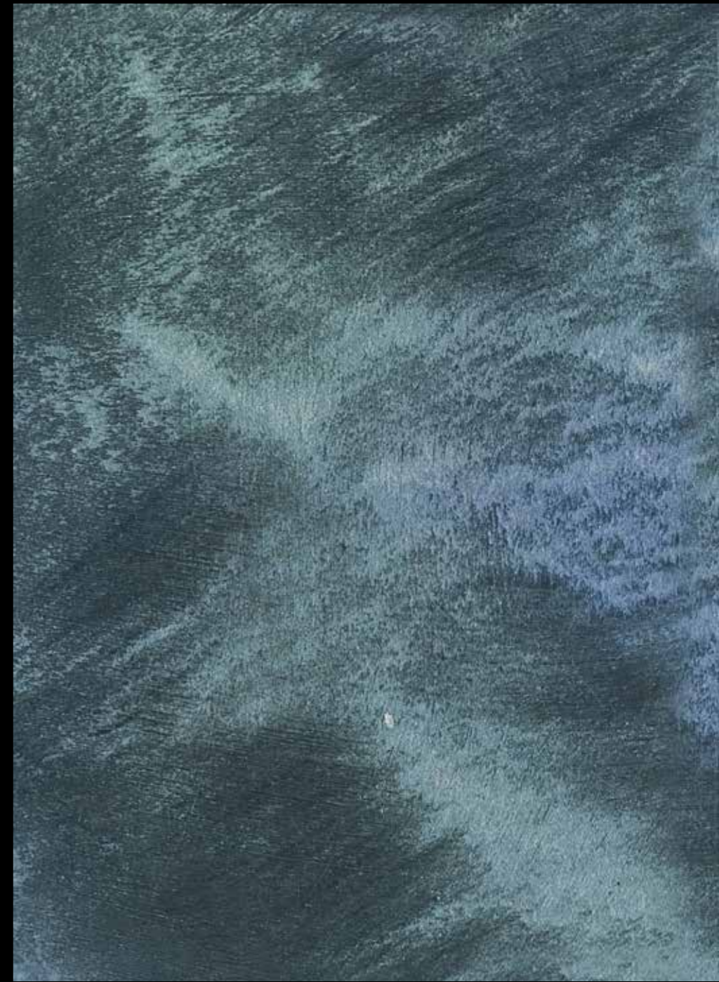
Rif. 1 NAUTILUS (LT. 1) + COLORI' Col. 451 A (80 ML.) MAVERICKS (LT. 0,500) + L50 Col. 304 (LT. 0,100) MAVERICKS (LT. 0,500) + L50 Col. 307 (LT. 0,100)