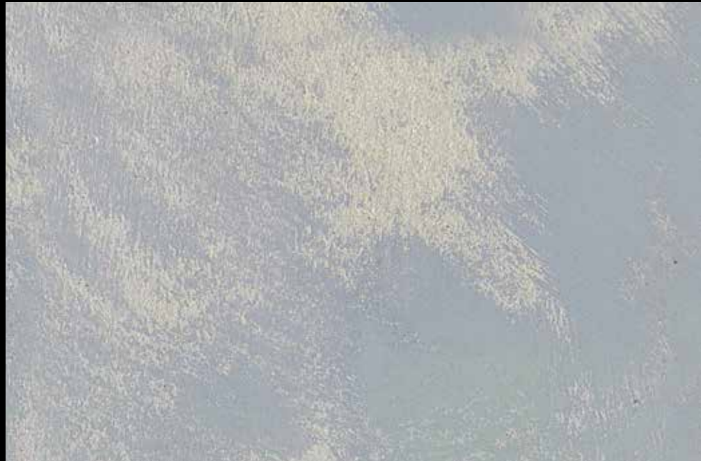
Rif. 4 NAUTILUS (LT. 1) + COLORI' Col. 448 C (2 ML.) MAVERICKS (LT. 0,500) + L50 Col. 303 (LT. 0,100) MAVERICKS (LT. 0,500) + L50 Col. 305 (LT. 0,100)