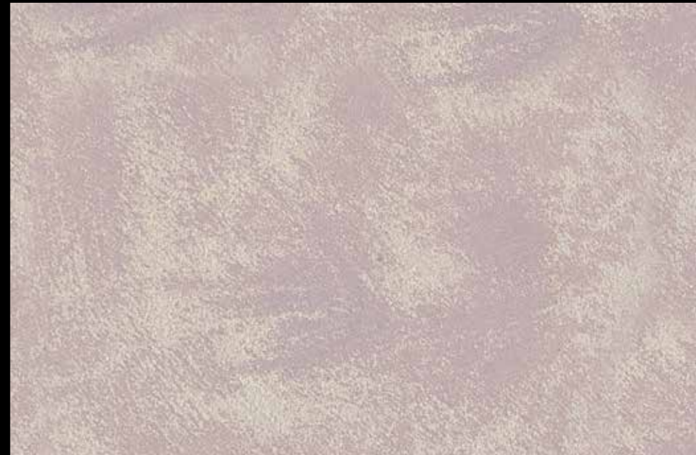
Rif. 11 NAUTILUS (LT. 1) + COLORI' Col. 472 C (2 ML.) MAVERICKS (LT. 0,500) + L50 Col. 304 (LT. 0,100) MAVERICKS (LT. 0,500) + L50 Col. 305 (LT. 0,100)