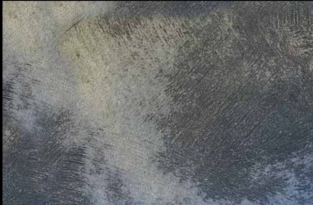
Rif. 22 NAUTILUS (LT. 1) + COLORI' Col. 451 A (80 ML.) MAVERICKS (LT. 0,500) + L50 Col. 305 (LT. 0,100) MAVERICKS (LT. 0,500) + L50 Col. 307 (LT. 0,100)