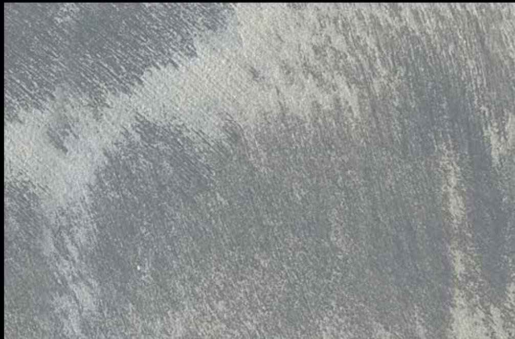
Rif. 15 NAUTILUS (LT. 1) + COLORI' Col. 448 B (10 ML.) MAVERICKS (LT. 0,500) + L50 Col. 302 (LT. 0,100) MAVERICKS (LT. 0,500) + L50 Col. 305 (LT. 0,100)