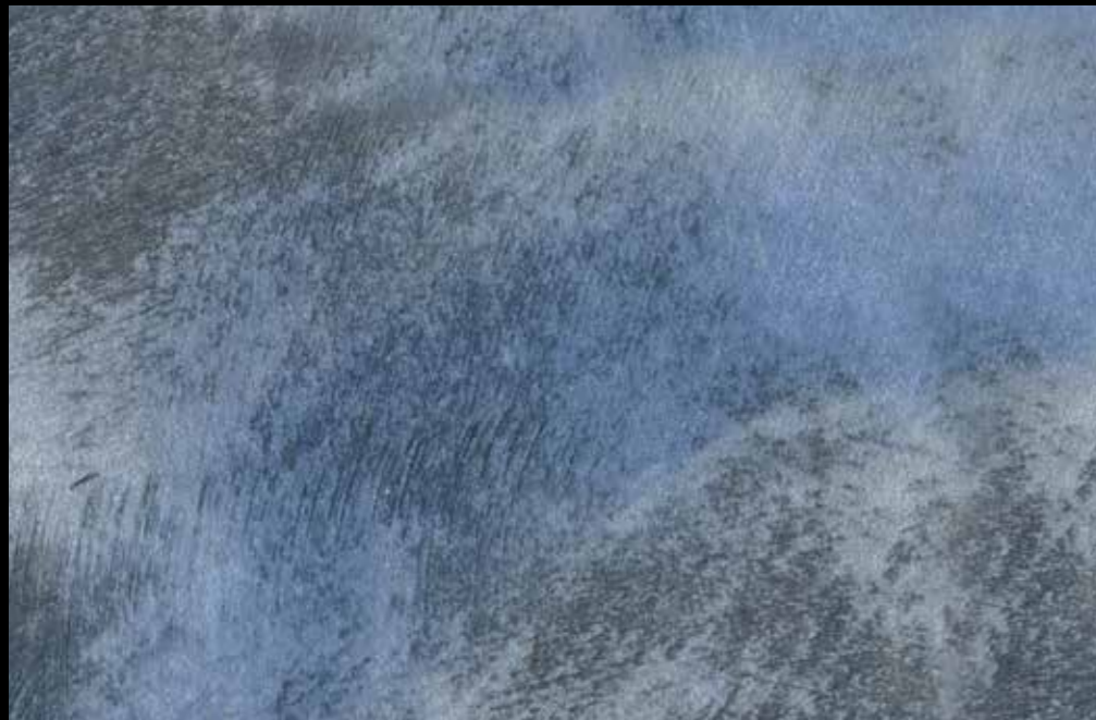
Rif. 23 NAUTILUS (LT. 1) + COLORI' Col. 451 A (80 ML.) MAVERICKS (LT. 0,500) + L50 Col. 302 (LT. 0,100) MAVERICKS (LT. 0,500) + L50 Col. 307 (LT. 0,100)