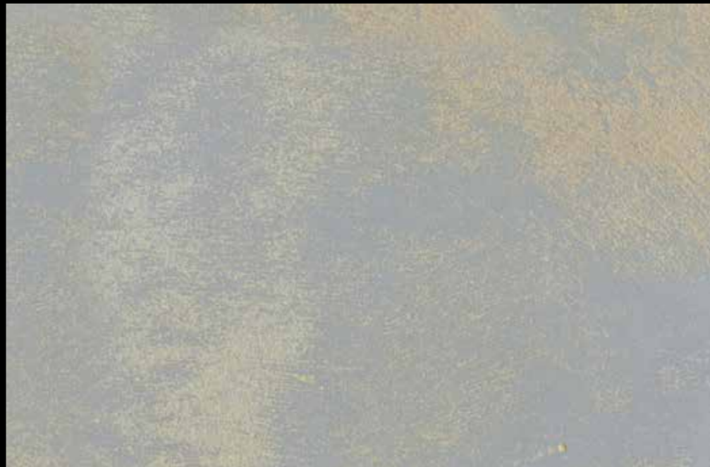
Rif. 18 NAUTILUS (LT. 1) + COLORI' Col. 448 C (2 ML.) MAVERICKS (LT. 0,500) + L50 Col. 304 (LT. 0,100) MAVERICKS (LT. 0,500) + L50 Col. 308 (LT. 0,100)