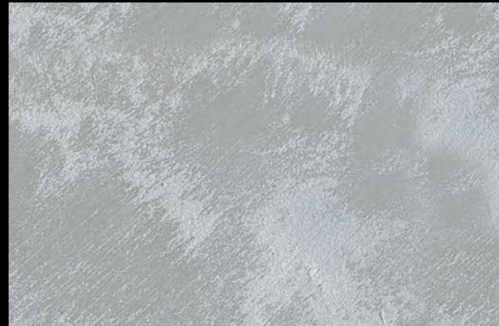
Rif. 25 NAUTILUS (LT. 1) + COLORI' Col. 448 C (2 ML.) MAVERICKS (LT. 0,500) + L50 Col. 302 (LT. 0,100) MAVERICKS (LT. 0,500) + L50 Col. 307 (LT. 0,100)