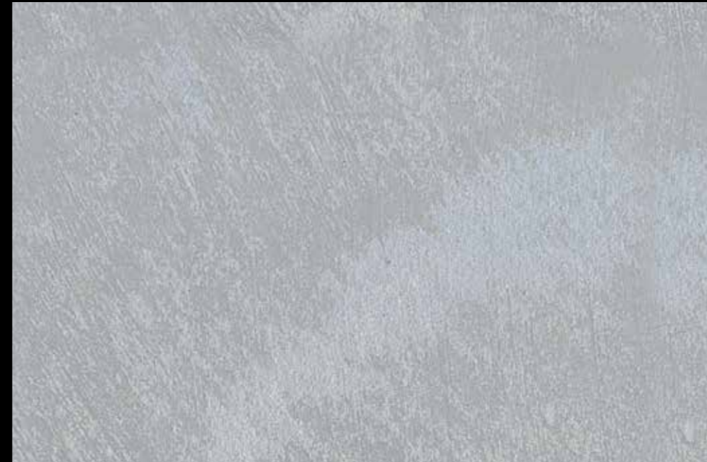
Rif. 20 NAUTILUS (LT. 1) + COLORI' Col. 448 C (2 ML.) MAVERICKS (LT. 0,500) + L50 Col. 305 (LT. 0,100) MAVERICKS (LT. 0,500) + L50 Col. 307 (LT. 0,100)