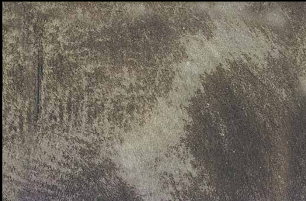
Rif. 2 NAUTILUS (LT. 1) + COLORI' Col. 451 A (80 ML.) MAVERICKS (LT. 0,500) + L50 Col. 303 (LT. 0,100) MAVERICKS (LT. 0,500) + L50 Col. 305 (LT. 0,100)