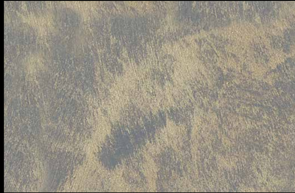
Rif. 12 NAUTILUS (LT. 1) + COLORI' Col. 448 B (10 ML.) MAVERICKS (LT. 0,500) + L50 Col. 305 (LT. 0,100) MAVERICKS (LT. 0,500) + L50 Col. 308 (LT. 0,100)