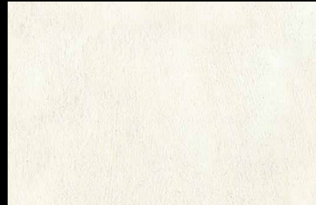
Rif. 5 NAUTILUS (LT. 1) MAVERICKS (LT. 0,500) + L50 Col. 303 (LT. 0,100) MAVERICKS (LT. 0,500) + L50 Col. 307 (LT. 0,100)