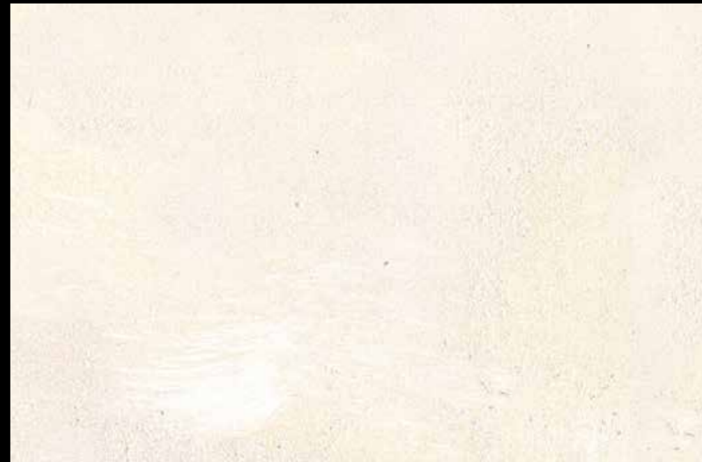
Rif. 19 NAUTILUS (LT. 1) MAVERICKS (LT. 0,500) + L50 Col. 304 (LT. 0,100) MAVERICKS (LT. 0,500) + L50 Col. 307 (LT. 0,100)