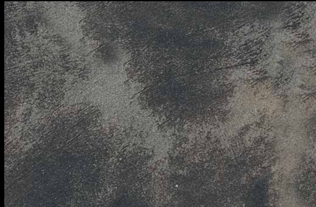
Rif. 13 NAUTILUS (LT. 1) + COLORI' Col. 451 A (80 ML.) MAVERICKS (LT. 0,500) + L50 Col. 301 (LT. 0,100) MAVERICKS (LT. 0,500) + L50 Col. 308 (LT. 0,100)