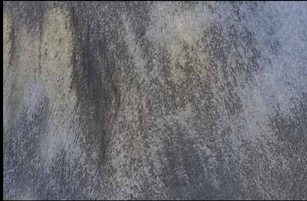
Rif. 9 NAUTILUS (LT. 1) + COLORI' Col. 461 A (80 ML.) MAVERICKS (LT. 0,500) + L50 Col. 305 (LT. 0,100) MAVERICKS (LT. 0,500) + L50 Col. 307 (LT. 0,100)