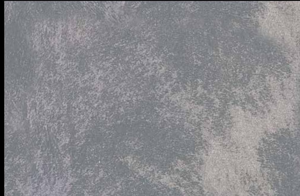
Rif. 3 NAUTILUS (LT. 1) + COLORI' Col. 448 B (10 ML.) MAVERICKS (LT. 0,500) + L50 Col. 303 (LT. 0,100) MAVERICKS (LT. 0,500) + L50 Col. 305 (LT. 0,100)