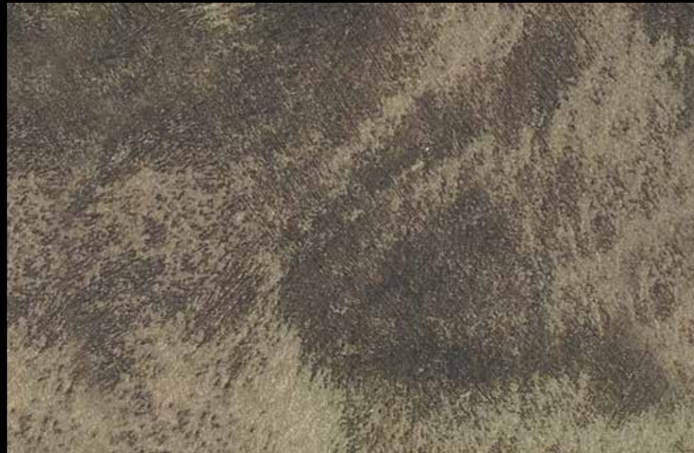
Rif. 8 NAUTILUS (LT. 1) + COLORI' Col. 451 A (80 ML.) MAVERICKS (LT. 0,500) + L50 Col. 305 (LT. 0,100) MAVERICKS (LT. 0,500) + L50 Col. 308 (LT. 0,100)