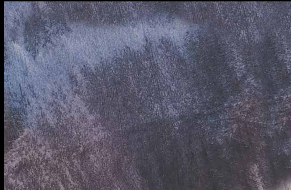
Rif. 7 NAUTILUS (LT. 1) + COLORI' Col. 461 A (80 ML.) MAVERICKS (LT. 0,500) + L50 Col. 306 (LT. 0,100) MAVERICKS (LT. 0,500) + L50 Col. 307 (LT. 0,100)