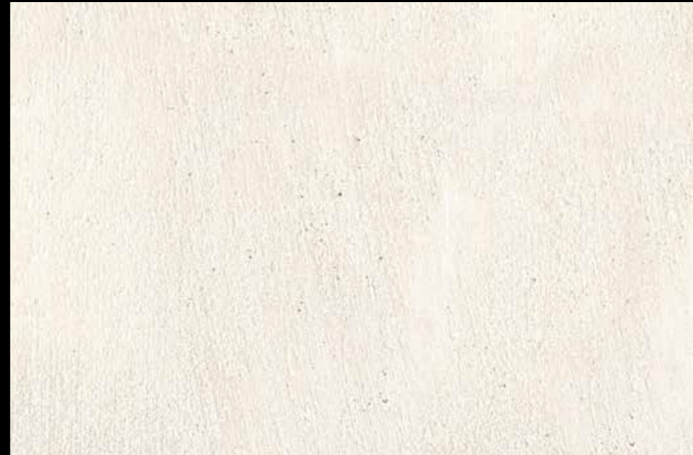
Rif. 16 NAUTILUS (LT. 1) MAVERICKS (LT. 0,500) + L50 Col. 302 (LT. 0,100) MAVERICKS (LT. 0,500) + L50 Col. 307 (LT. 0,100)