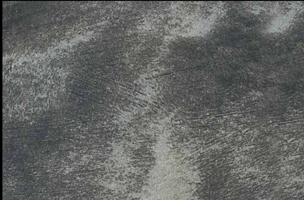
Rif. 14 NAUTILUS (LT. 1) + COLORI' Col. 451 A (80 ML.) MAVERICKS (LT. 0,500) + L50 Col. 302 (LT. 0,100) MAVERICKS (LT. 0,500) + L50 Col. 305 (LT. 0,100)