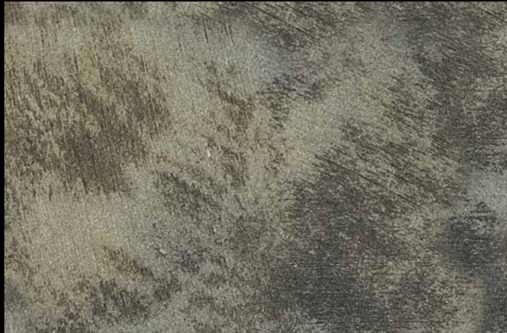
Rif. 17 NAUTILUS (LT. 1) + COLORI' Col. 451 A (80 ML.) MAVERICKS (LT. 0,500) + L50 Col. 301 (LT. 0,100) MAVERICKS (LT. 0,500) + L50 Col. 305 (LT. 0,100)