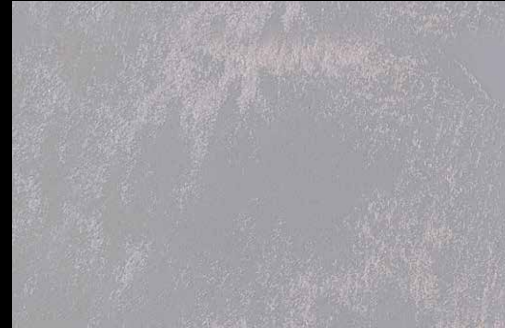
Rif. 6 NAUTILUS (LT. 1) + COLORI' Col. 461 C (2 ML.) MAVERICKS (LT. 0,500) + L50 Col. 306 (LT. 0,100) MAVERICKS (LT. 0,500) + L50 Col. 307 (LT. 0,100)