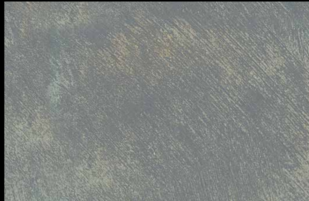
Rif. 21 NAUTILUS (LT. 1) + COLORI' Col. 448 B (10 ML.) MAVERICKS (LT. 0,500) + L50 Col. 304 (LT. 0,100) MAVERICKS (LT. 0,500) + L50 Col. 308 (LT. 0,100)