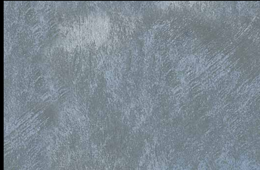
Rif. 24 NAUTILUS (LT. 1) + COLORI' Col. 448 B (10 ML.) MAVERICKS (LT. 0,500) + L50 Col. 302 (LT. 0,100) MAVERICKS (LT. 0,500) + L50 Col. 307 (LT. 0,100)